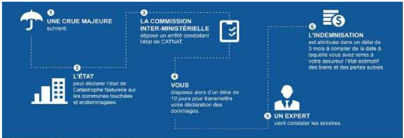
Cheminement de la déclaration de catastrophe naturelle

En cas de crue majeure, l'État peut déclarer l'état de Catastrophe Naturelle sur les communes touchées et endommagées. Après l'arrêté interministériel constatant l'état de CATNAT, vous disposez d'un délai de 10 jours pour transmettre votre déclaration des dommages.